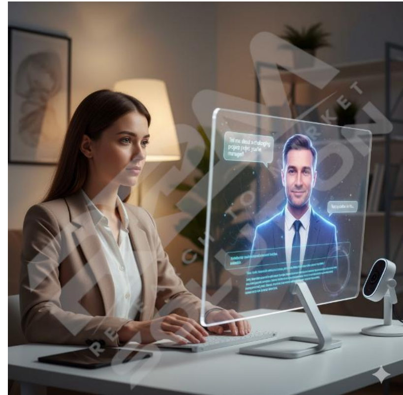
Immagine di Gemini AI su prompt dell'Autore