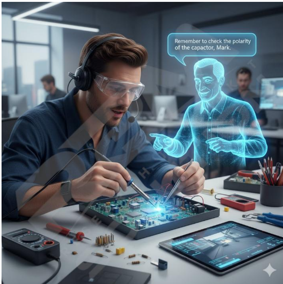
Immagine di Gemini AI su prompt dell'Autore